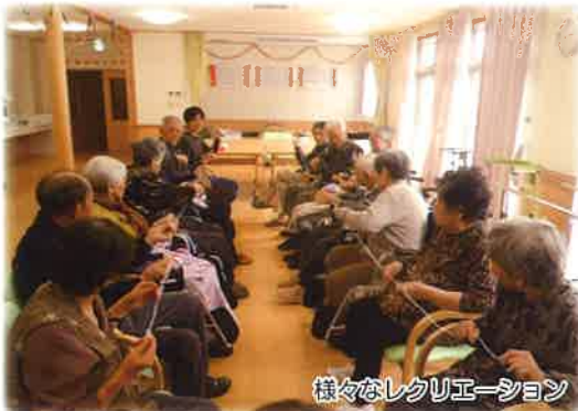
様々なレクリエーション