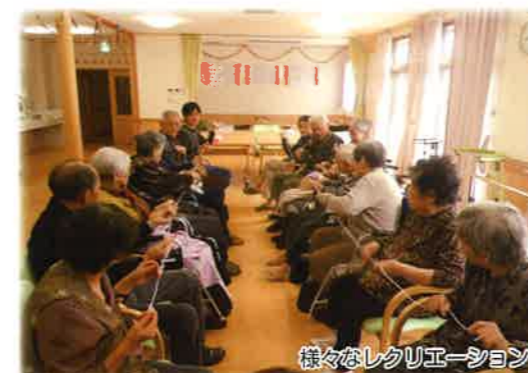
様々なレクリエーション