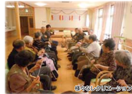
様々なレクリエーション